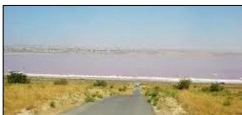
マサズイル・ギェルのピンク色の湖