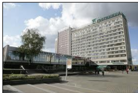
ミンスク：ユビレイナヤホテル