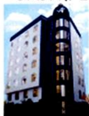
ベレパレス(トビリシ)

旧市街にある1999年築ビジネスマン向き、全バスタブ付。他に、トリ(トルコ系新しいホテル、市の中心部)、スベリーメテヒ、シェラトンパレスに変わることあります。