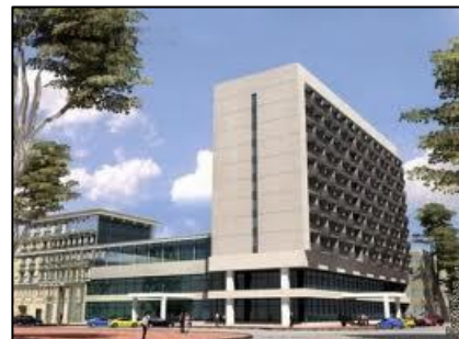
オデッサ：チョールナエ・モーレ