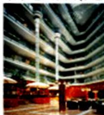
メテヒパレス(トビリシ)

旧市街にある1999年築ビジネスマン向き、全バスタブ付。他に、トリ(トルコ系新しいホテル、市の中心部)、スベリーメテヒ、シェラトンパレスに変わることあります。