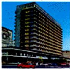
アニプラザ(エレバン)