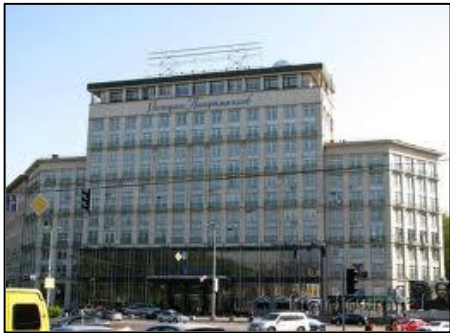
キエフ：ドニプロ・ホテル