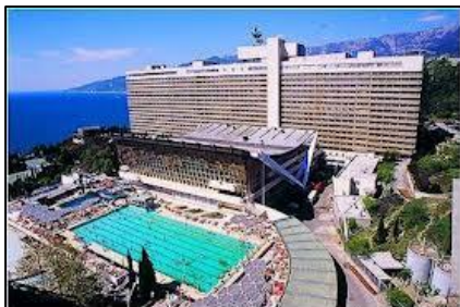
ヤルタ：ヤルタホテル