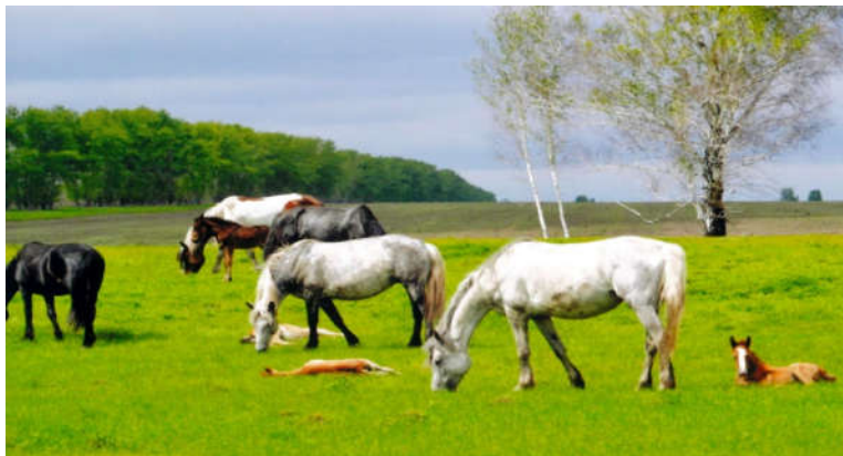
▲4月下旬のモスクワ郊外の風景。春のロシア台地の息吹き体感