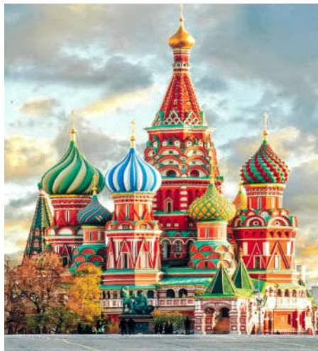
▲ロシアの象徴聖ワシリー寺院