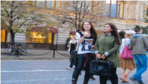
▲4月中旬、モスクワ方々の風景。