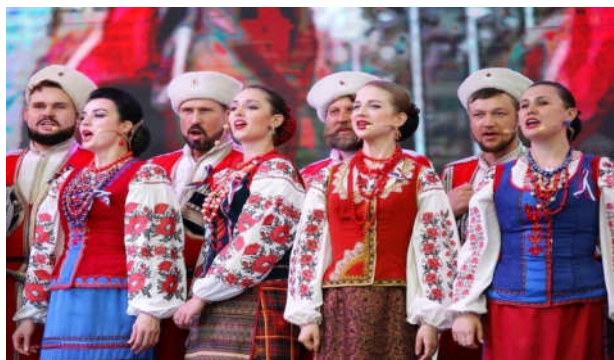
▲ロシア民謡 雄大な大地を彷彿させる歌ごえ。コサックダンスもセットになっているロシア民族アンサンブル。