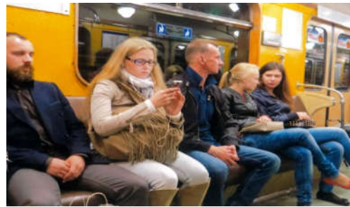
▲モスクワの地下鉄。移動は地下鉄をおすすめ。