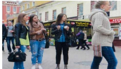
▲3月下旬、モスクワ・アルバート通りの風景。