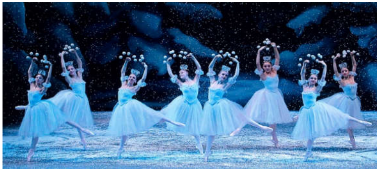
▲世界の頂点に輝くロシアバレエ。ロシアで最も伝統と格式ある名門劇場。世界バレエの基準ワグノワメソッドの頂点マリインスキー劇場。