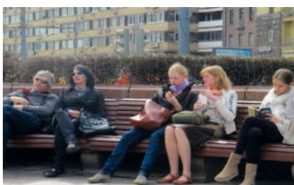
▲3月上旬、モスクワの団地の春さき。