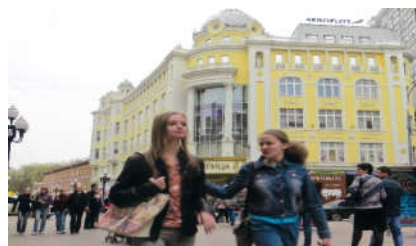
▲3月下旬、モスクワ市内の風景