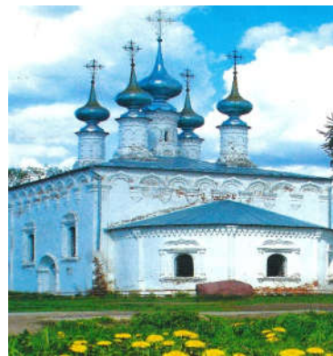
◀4月下旬、モスクワの郊外の教会。