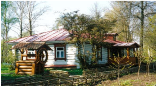
▲4月中旬、モスクワの郊外の農家。