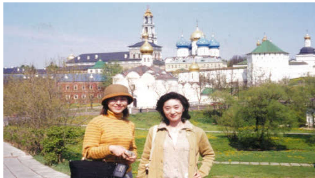
▲4月下旬のモスクワ郊外、世界遺産セルギエフ・ポサド