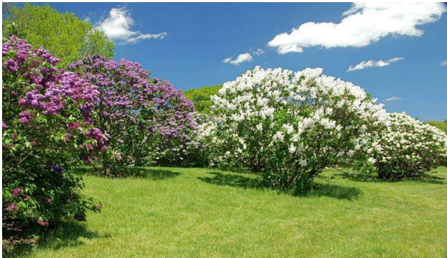
▲ライラックの花畑