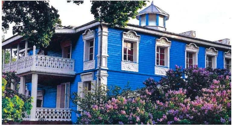
▲イワノフカ村のラフマニノフの家博物館。