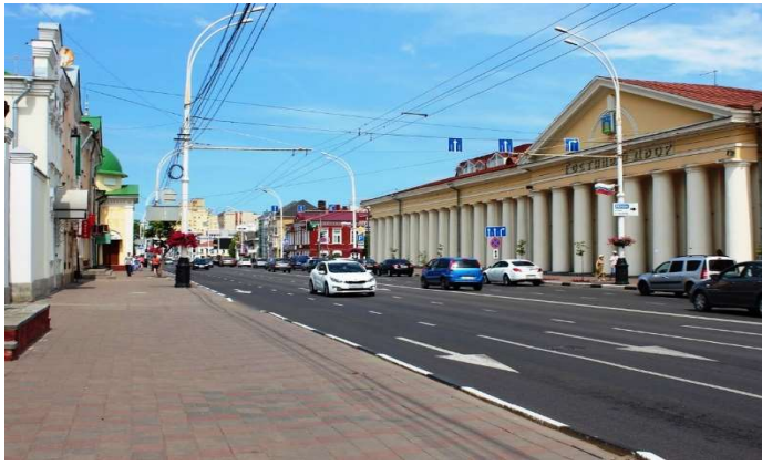
▲タンボフ市は人口約30万人、モスクワから南東480kmでタンボフの州都。ロシア最古のドラマ劇場、ラフマニノフの像、ラフマニノフ通り、音楽学校、美術館と2つの大学があります。