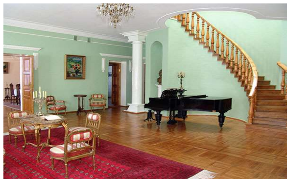
▲ラフマニノフの家博物館