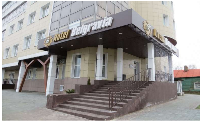
▲ホテル・ベルグレヴァ。4ツ星クラス、駅から2.1km市の中心地近く。バスタブ付。