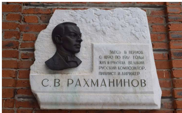
▲博物館入口(1890年～1917年住み活動していた家)