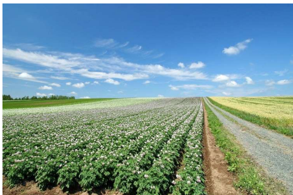
▲南ロシアの畑風景