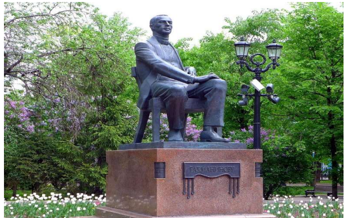
▲モスクワのプーシキン広場近くのラフマニノフの像。