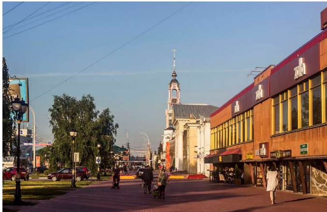
▲タンボフ市の夕暮れ。