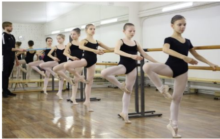
レッスン風景見学