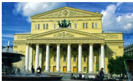
▲ボリショイ劇場。豪華さと巨大さは世界一、ロシアの顔。スケールの大きさ、情熱的で劇的なバレエ。入材が豊富。