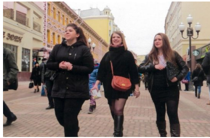
3月上旬のモスクワ