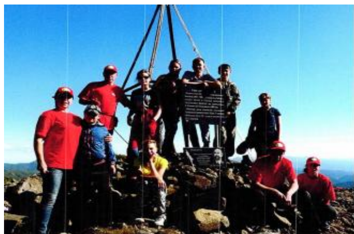
ロパーチナ山1,609m山頂