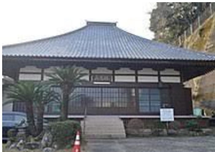
ロシア人たちの眠る宝泉寺