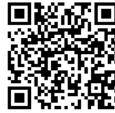
ウズベキスタン文化観光局